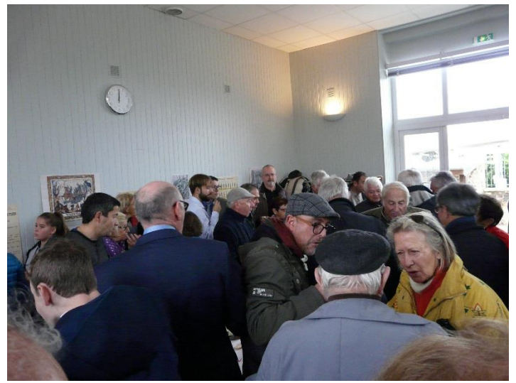
Environ 80 personnes ont assisté au repas. Une ambiance chaleureuse et conviviale !