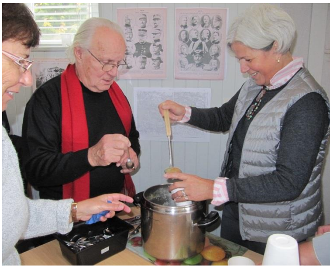
Pour le repas, une soupe des tranchées, confectionnée avec des produits locaux, a été servie... un véritable succès !