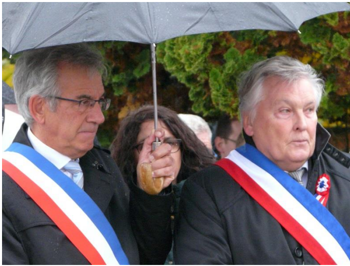
Le Conseil Municipal était présent accompagné de 80 personnes environ, malgré la pluie battante. Les cloches de l'église retentissent à 11 heures.