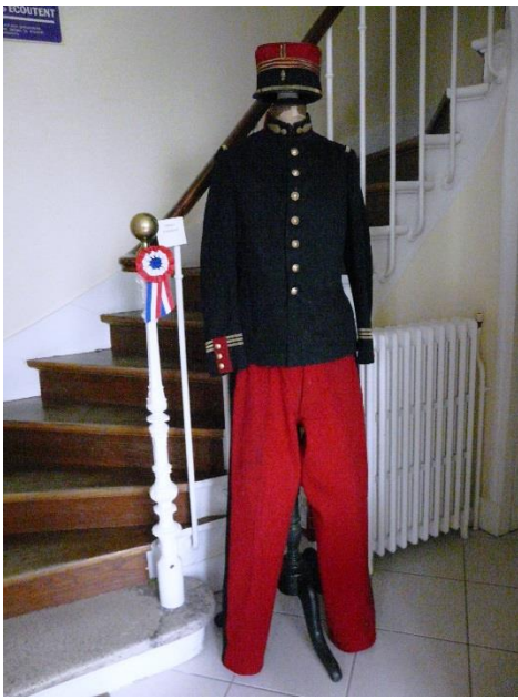
← Uniforme d'un officier